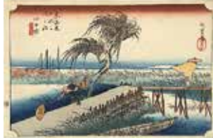
「東海道五拾三次之内 四日市 三重川」歌川広重

広重の代名詞ともいえる「東海道五十三次」。季節や天候、時間の移ろいなどを織り交ぜながら描かれたその浮世絵は、人々の旅へのあこがれをかきたて、心の旅へととぎやいました。当時の人々は街道でどんな風景を見て、どんな経験ををしたのでしょうか。広重の浮世絵を眺めながら、江戸日本橋から京三条大橋まで125里(約500km)の旅に出かけましょう。