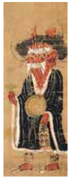
「鬼の念仏」(公益財団法人日動美術財団所蔵)

東海道の天津周辺で販売された大津絵は、土産物として旅人たちの人気を博し、江戸時代の庶民にとって浮世絵に並ぶ身近な絵画作品でした。明治以降は国内外の画家や著名人により収集の対象となります。愛嬌のあるユーモラスな姿の美人や鬼、動物たちは、現代の私たちが見ても楽しめるものばかり。時代を超えて人々の心を惹きつけてきた大津絵の世界をご堪能ください。